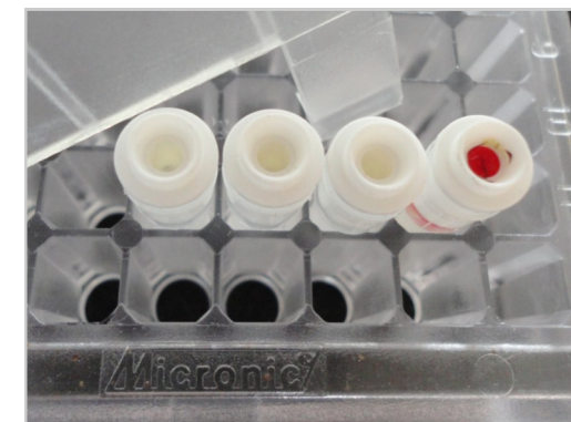
Trygt og enkelt å bruke, profesjonelt resultat.