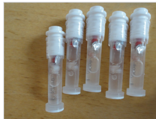
Vevsprøver samles automatisk i lukkede tuber.