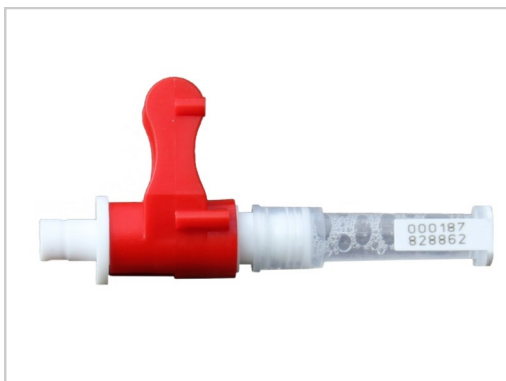
Id-merkede tuber leveres i ulike forpakninger.