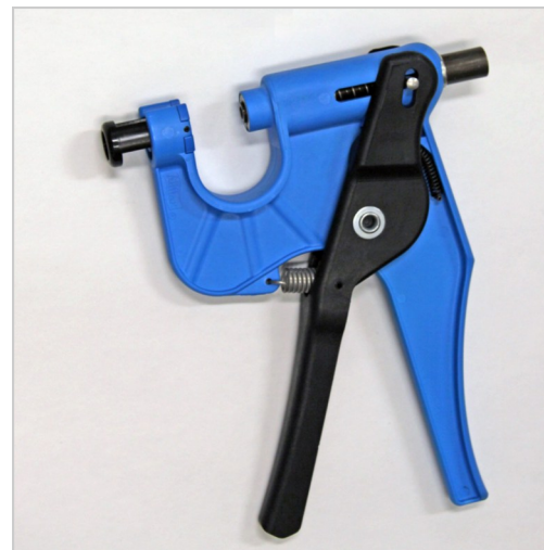
OS ID ® TSU pistol for prøvetaking

OS ID TSU kan også brukes i kombinasjon med visuelle merker. Merker og tuber kan leveres med identiske nummer.